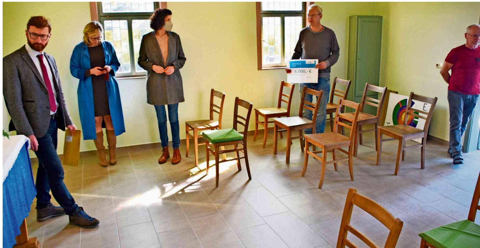
Gelungenes Ergebnis: Die Sanierung des Innenraums der Friedhofskapelle Zum ewigen Troste auf dem Parkfriedhof Metzels ist abgeschlossen.